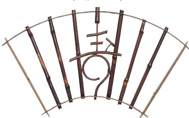
品番：22-7 品名：鑄竹測付扇形窓(寿柄)本スス