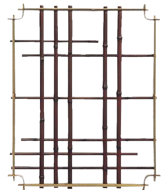
品番：21-7 品名：鑄竹測付角窓(格子柄)純スス