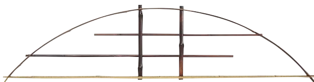
品番：23-2 品名：鑄竹測付クシ型ランマ用窓(抜き通し)純スス