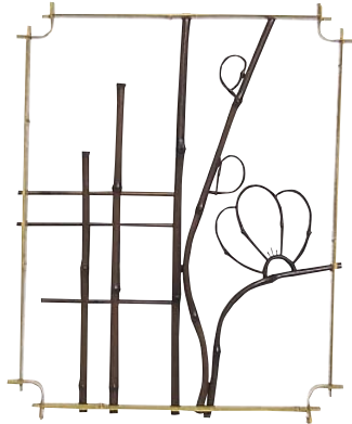
品番：21-5 品名：鑄竹測付角窓(梅柄)純スス