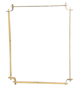
品番：22-12 品名：鑄竹測(角)窓