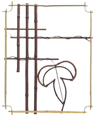
品番：21-6 品名：鑄竹測付角窓(つた柄)純スス