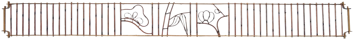
品番：23-1 品名：鑄竹測付ランマ用窓(松竹梅柄)純スス