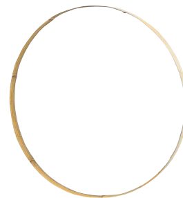
品番：22-13 品名：鑄竹測(丸)窓