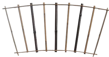
品番：23-6 品名：鑄竹測付扇形窓 純スス