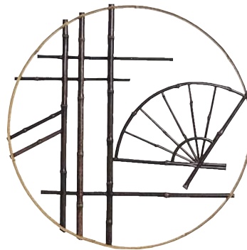
品番：23-3 品名：鑄竹測付黒竹丸窓(扇柄)