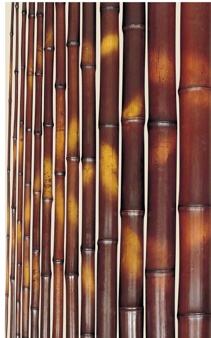
品名：19-10 人工ス竹(ほかし)(真竹)