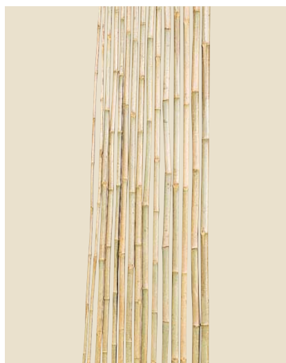
品名：19-4 寒竹(かんちく)