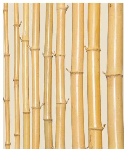
品名：19-2 (防虫品) 晒芽付竹(さらしめつきだけ)(真竹)