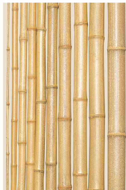
品名：19-1 錆竹 (さびだけ)

※径(寸)は、6.5尺(約2000mm)以下は元口、10尺(約3000mm)以上は目通り(目の高さ)のサイズです。