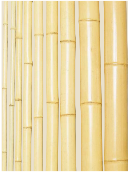
品名：18-1 晒竹(さしだけ) (真竹)

※径(寸)は、6.5尺(約2000mm)以下は元口、10尺(約3000mm以上)は目通り(目の高さ)のサイズです。