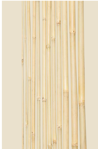
品名：18-5 女竹(めだけ) (防虫品)