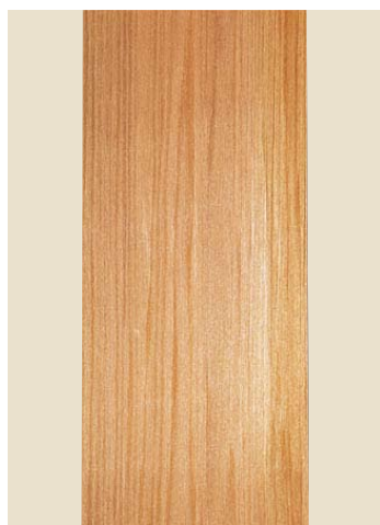
品番: 32-1 品名: 黒部板目へぎ板 寸法/単価 5×3.25(152×985) ¥132,000 (尺)(坪) (坪 24枚入)