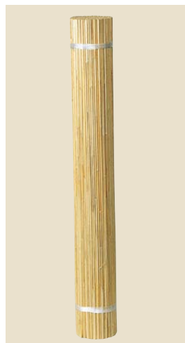
品番: 40-14 品名: 蒲芯糸通し 寸法/単価 3×6(910×1,820) ¥8,000 (尺)(枚)