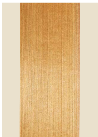
品番: 32-2 品名: 黒部柱目へぎ板 寸法/単価 5×3.25(152×985) ¥115,000 (尺)(坪) (坪 24枚入)