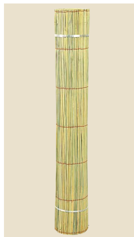
品番: 40-17 品名: まこもロール 寸法/単価 3×6(910×1,820) ¥13,000 (尺)(枚)