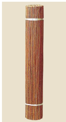
品番: 40-13 品名: 代萩針金通し 寸法/単価 3×6(910×1,820) ¥23,000 (尺)(枚)