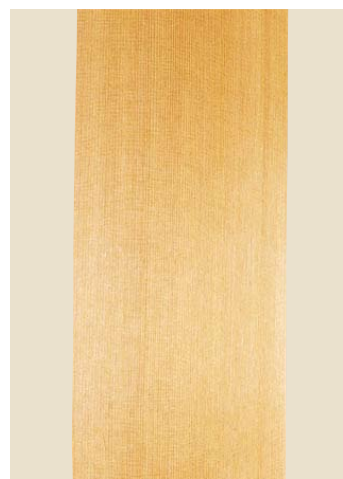
品番: 32-4 品名: 樫柱目へぎ板 寸法/単価 5×3.25(152×985) ¥100,000 (尺)(坪) (坪 24枚入)