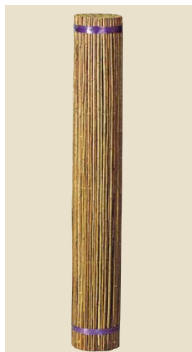
品番: 40-12 品名: 本萩針金通し 寸法/単価 3×6(910×1,820) ¥55,000 (尺)(枚)