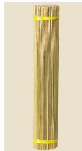
品番: 40-15 品名: 蒲葉糸通し 寸法/単価 3×6(910×1,820) ¥38,000 (尺)(枚)