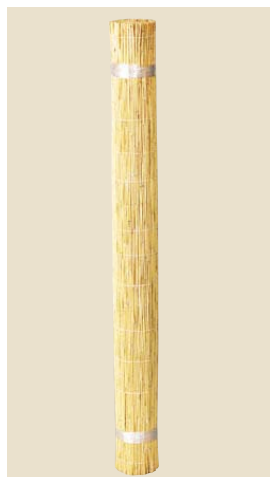
品番: 40-16 品名: 天津ヨシ上糸編 寸法/単価 3×6(910×1,820) ¥4,900 (尺)(枚)