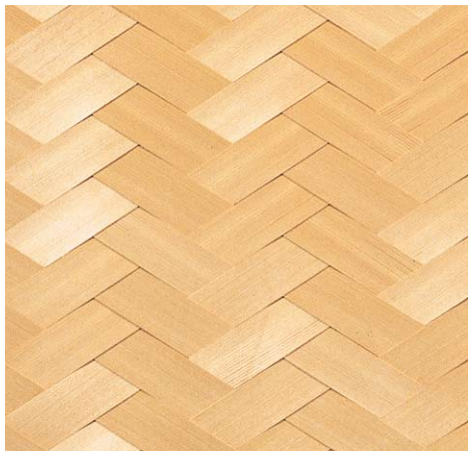
品名: 9-14 榎つき板矢羽根網代 (単板巾1.5寸(45mm)) 寸法/尺(mm) 単価/枚 寸法/尺(mm) 単価/枚 3×6(910×1820) ¥52,000 別注品 1尺(303)角 ¥5,500 3.15×6.3(955×1910) ¥60,000 ※ハス市松・市松網も出来ます。