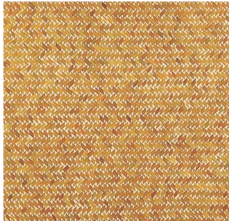
品番: 9-9 品名: 染竹矢羽根網代濃色 (3分(9mm)巾) 寸法/尺(mm) 単価/枚 寸法/尺(mm) 単価/枚 3×6(910×1820) ¥68,000 別注品 1尺(303)角 ¥6,550 3.15×6.3(955×1910) ¥86,000 1尺(303)角(和紙貼) ¥5,950