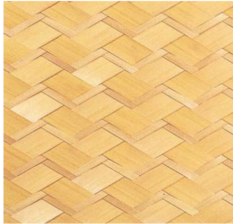
品番: 9-6 (5.5mmベニヤ) 品名: 榎へぎ板特選親子矢羽根網代 (単板巾5分(15mm)×1.5寸(45mm)) 寸法/単価 (R(mm)) (枚) 3×6(910×1820) ¥99,500 3.15×6.3(955×1910) ¥115,000 別注品 1尺(303)角 ¥7,850