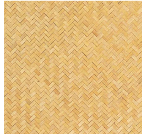
品名: 9-7 白身皮ハタ矢羽根網代 (4mmベニヤ) (竹巾5分(15mm)) 寸法/尺(mm) 単価/枚 寸法/尺(mm) 単価/枚 3×6(910×1820) ¥65,800 別注品 1尺(303)角 ¥7,200 3.15×6.3(955×1910) ¥81,800 1尺(303)角(和紙貼) ¥6,700 ※竹巾3分(12mm)も出来ます。