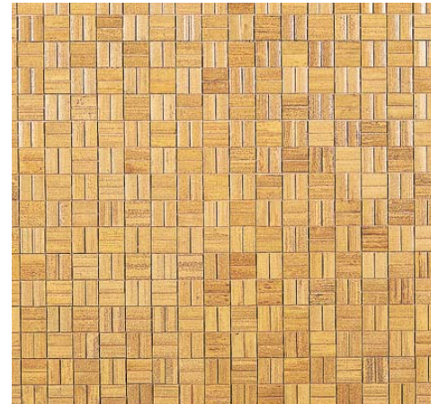
品番: 9-10 (5.5mmベニヤ) 品名: 錆竹モザイク (竹巾1.2寸(36mm)×6分(18mm)) 寸法/単価 (R(mm)) (枚) 3×6(910×1820) ¥105,000 ※図面竹・晒錆竹も出来ます。