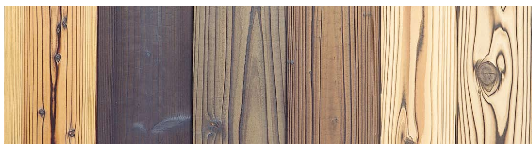
品名: 源平 (浮造) 品名: 黒 (塗装) 品名: 塗装 (2) (浮造) 品名: 塗装 (1) (浮造) 品名: 赤 (浮造) 品名: 白 (浮造)