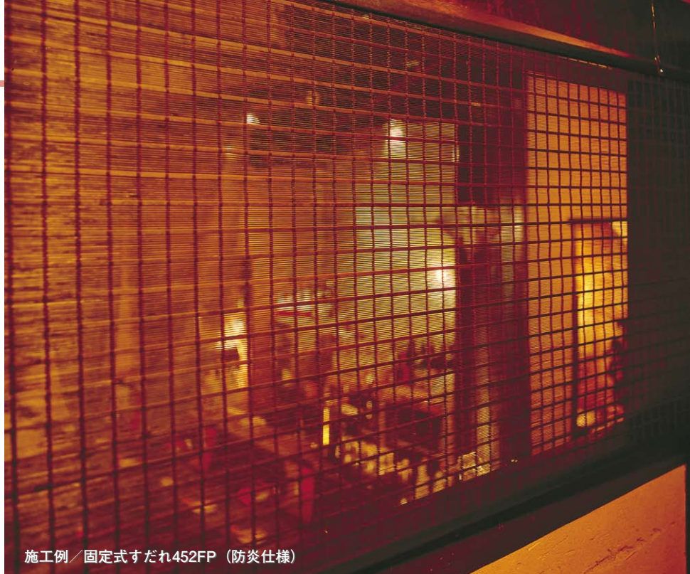
施工例 / 固定式すだれ452FP (防炎仕様)