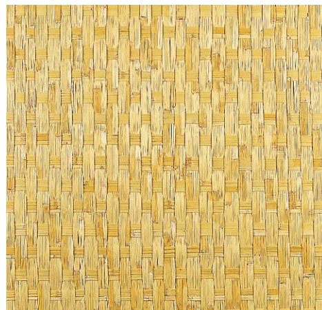
品名：146 ヨシアジロ(市松)