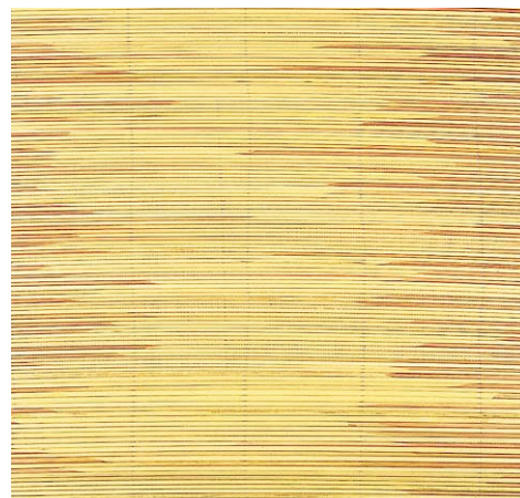
品名：130A 山ヨシ半割ベニヤ