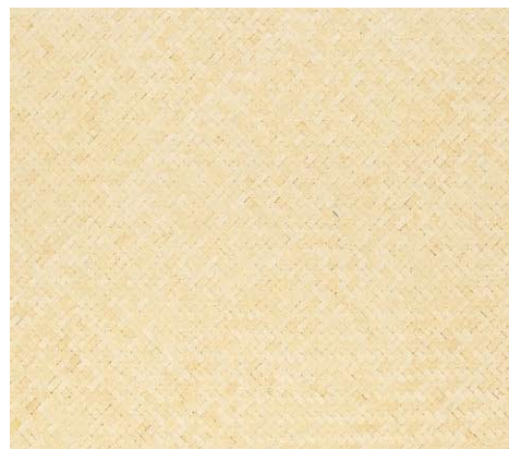
品名：127A 竹アジロ(4分巾)(ウレタン塗布品)