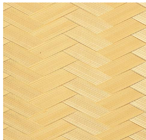
品名：151 杉紐アジロ矢バネ(薄)単板0.3mm