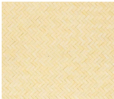
品名：127 竹アジロ(ウレタン塗布品)