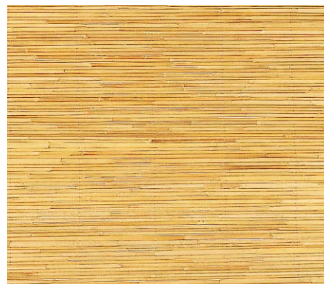
品名：170 ガマ芯糸通しベニヤ(サツマヨシ)