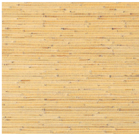
品名：103 ヨシボード(黄)