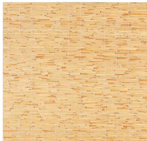
品名：108 天津ヨシベニヤ