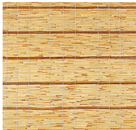
品名：109 天津糸入ベニヤ