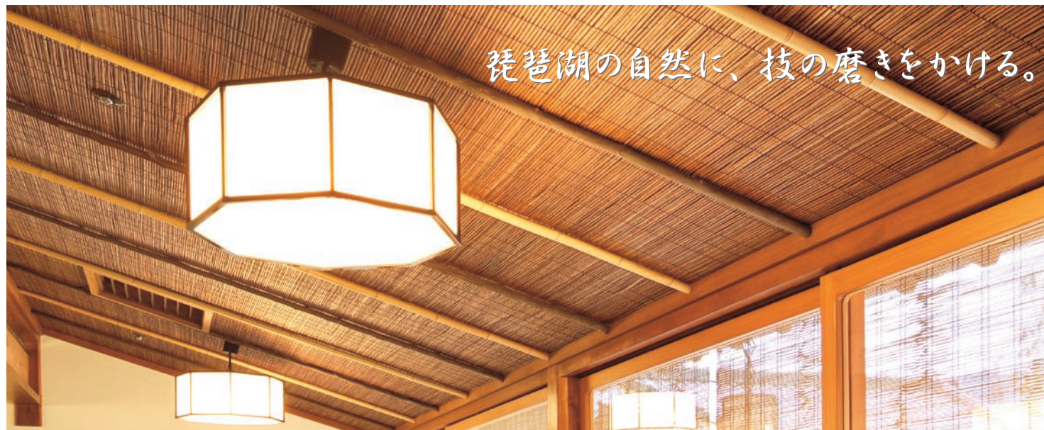
(社) 日本建材・住宅設備産業協会 F☆☆☆☆ 表示登録番号 K-000269・K-000270