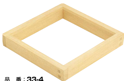
品番：33-4 品名：沢栗炉縁 単価 ¥138,000