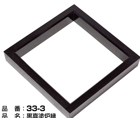
品番：33-3 品名：黒真塗炉縁 単価 ¥105,000