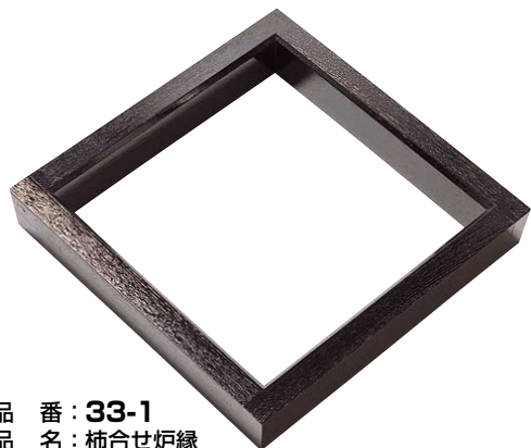
品番：33-1 品名：柿合せ炉縁 単価 ¥33,000