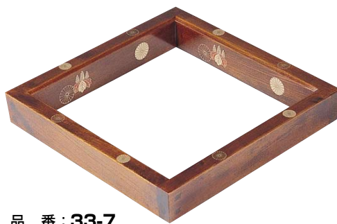
品番：33-7 品名：高台寺吹漆炉縁 単価 ¥50,000