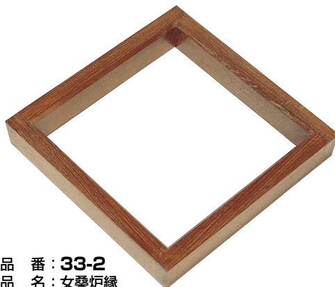
品番：33-2 品名：女桑炉縁 単価 ¥38,000