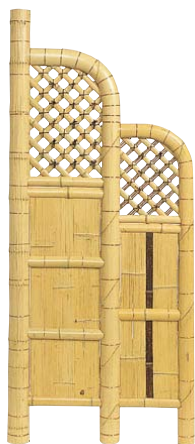
品番：27-6 高さ5.5尺(1650mm) 品名：図面竹一文字垣 巾/R(mm) 枚単価 巾/R(mm) 枚単価 1.5(450) ¥58,000 2.3(690) ¥74,500 1.8(540) ¥58,000 2.5(750) ¥79,500 2.0(600) ¥63,500 3.0(900) ¥96,000