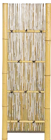
品番：27-9 高さ5.5尺(1650mm) 品名：矢どめ垣 巾/R(mm) 枚単価 巾/R(mm) 枚単価 1.5(450) ¥49,400 2.3(690) ¥62,800 1.8(540) ¥49,400 2.5(750) ¥67,400 2.0(600) ¥55,400 3.0(900) ¥80,800