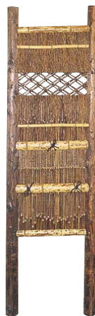
品番：27-10 高さ7尺 品名：焼丸太黒穂垣 巾/R(mm) 枚単価 巾/R(mm) 枚単価 1.5(450) ¥55,000 2.3(690) ¥69,000 1.8(540) ¥55,000 2.5(750) ¥75,000 2.0(600) ¥60,000 3.0(900) ¥90,000