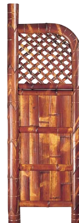
品番：27-13 高さ3尺(900mm) 品名：本煤竹玉袖垣 巾/R(mm) 枚単価 2.0(600) ¥139,000 2.5(750) ¥173,800