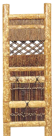
品番：27-3 高さ5.5尺(1650mm) 品名：屋根付袖垣 巾/R(mm) 枚単価 巾/R(mm) 枚単価 2.0(600) ¥76,000 2.5(750) ¥94,000 2.3(690) ¥87,000 3.0(900) ¥115,000