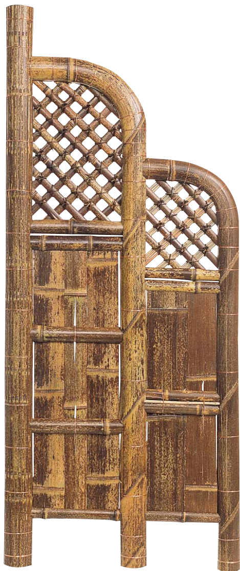
品番：27-2 高さ5.5尺(1650mm) 品名：図面竹角型黒穂垣 巾/R(mm) 枚単価 巾/R(mm) 枚単価 1.5(450) ¥49,000 2.3(690) ¥62,000 1.8(540) ¥49,000 2.5(750) ¥680,00 2.0(600) ¥55,000 3.0(900) ¥80,000