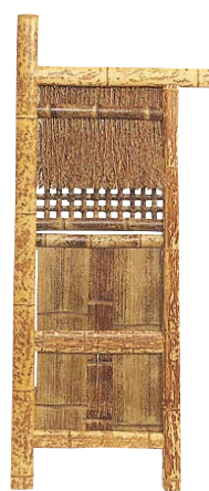
品番：27-7 高さ5.5尺(1650mm) 品名：図面竹一文字垣(亀甲竹) 巾/R(mm) 枚単価 巾/R(mm) 枚単価 2.0(600) ¥70,500 2.5(750) ¥89,000 2.3(690) ¥82,000 3.0(900) ¥106,000