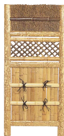
品番：27-1 高さ5.5尺(1650mm) 品名：寅竹二重玉袖垣 巾/R(mm) 枚単価 2.3(690) ¥120,000 2.5(750) ¥130,000 3.0(900) ¥157,000