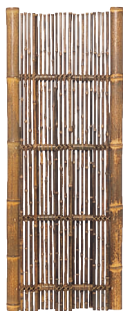
品番：27-8 高さ5.5尺(1650mm) 品名：寅竹あやめ垣 巾/R(mm) 枚単価 巾/R(mm) 枚単価 1.8(540) ¥61,000 2.5(750) ¥84,000 2.0(600) ¥67,000 3.0(900) ¥101,000 2.3(690) ¥77,500